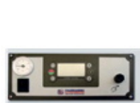
自動制御コントローラー

燃焼炉とボイラー熱交換部分その他燃料供給装置を施したシンプルな構造で、耐久性抜群でヨーロッパでは25年以上の実績があります