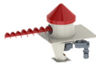
モリロン攪拌送り装置