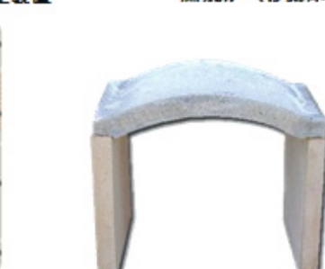
セラミック製炉内壁